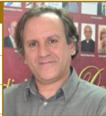
Presidente Junta Directiva