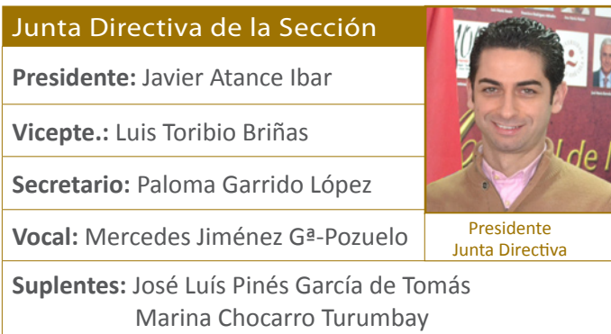
Presidente Junta Directiva

Desde la Sección Profesional de Orientadores, Psicopedagogos y Pedagogos del Colegio potenciaremos y apoyaremos las tareas y funciones que los orientadores realizan diariamente en sus centros: