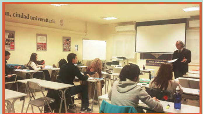
Aulas de formación en Alcázar de San Juan