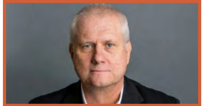
Tom Rudmik, pionero internacional en transformación educativa

El Instituto Internacional de Aprendizaje Advance Learning nace de la necesidad de una auténtica transformación del sistema educativo, ofreciendo innovadoras metodologías y técnicas de aprendizaje para profesionales de la educación. Dicha transformación debe plantearse en profundidad, cuestionándose de manera exhaustiva la selección de contenidos, la búsqueda y determinación de las metodologías más convenientes y la implantación de recursos de aprendizaje más adecuados.