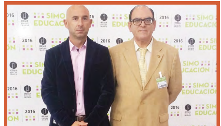
El Decano y el Secretario General del Colegio participaron en las actividades del SIMO 2016.

por Escuelas Católicas, o la Jornada Internacional de Transferencia de Tecnología y Cooperación Empresarial de la Fundación para el Conocimiento, con el objetivo de facilitar la comunicación y el encuentro entre empresas, centros de investigación y universidades del sector de las tecnologías para la educación.