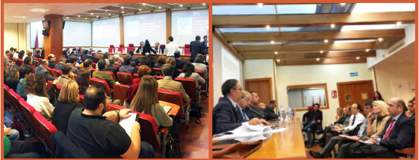
Salón de actos del Colegio Oficial de Gestores Administrativos de Madrid

Firmaprofesional organizó la primera jornada sobre la transformación digital de los Colegios, para que sus responsables conocieran cómo puede influir esta nueva tendencia en las organizaciones profesionales.